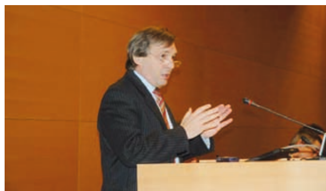
Jeannot Krecké, Ministre de l'Economie et du Commerce extérieur