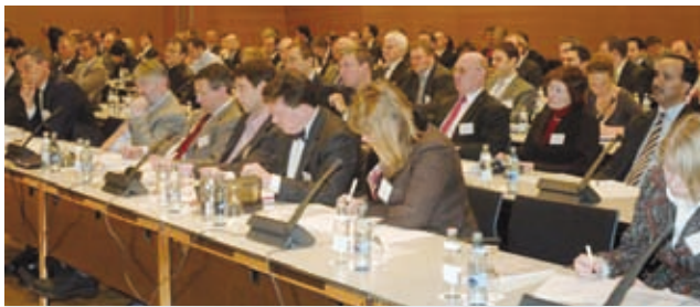
Une conférence bien visitée

L'Observatoire de la Compétitivité du Ministère de l'Économie et du Commerce extérieur, en collaboration avec la Chambre de Commerce et PriceWaterhouseCoopers, a organisé le 13 février 2007 une conférence intitulée "La Journée de l'Économie: Le défi de la diversification - Le point de vue des CEOs", en présence du ministre de l'Économie et du Commerce extérieur, M. Jeannot Krecké . La conférence a connu un grand succès avec près de 160 inscriptions. Relever le défi de la diversification constitue en effet un objectif très important à la fois pour l'économie luxembourgeoise en général et pour de nombreux chefs d'entreprise.