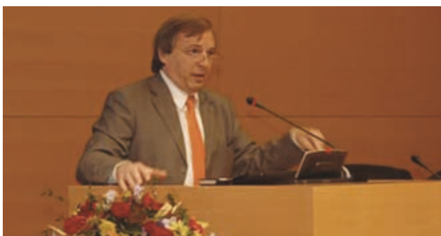
Jeannot Krecké, Ministre de l'Économie et du Commerce extérieur

Le Ministre a ensuite mis en évidence que le Luxembourg doit davantage investir dans la R&D et la formation. De plus, il faut garantir un cadre fiscal compétitif ainsi qu'un environnement juridique adapté aux entreprises. Un climat de confiance générale constitue un facteur-clé à conserver.